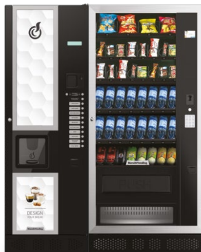
LEI600 + ARIA L MASTER

LEI600, distributore automatico per bevande calde con capacità di 600 bicchieri.